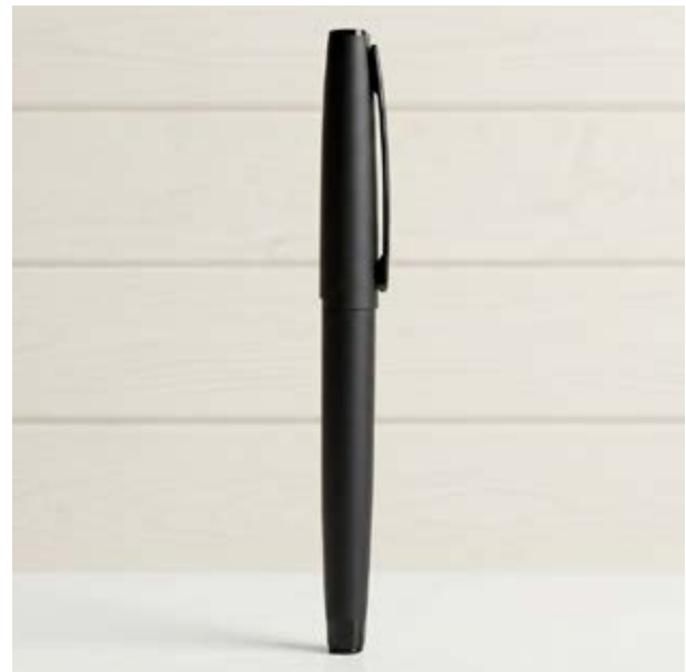
BOL 573 Bolígrafo Top Black