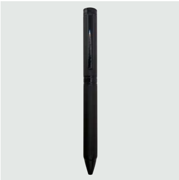
BOL 526 Bolígrafo Carrington