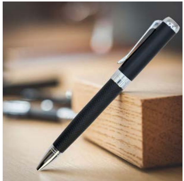
BOL 524 Bolígrafo Lautrec