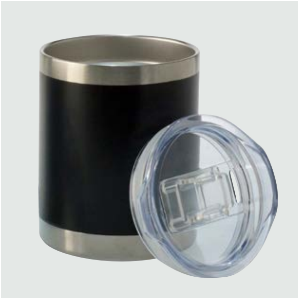
TH 202 Tarro Encino