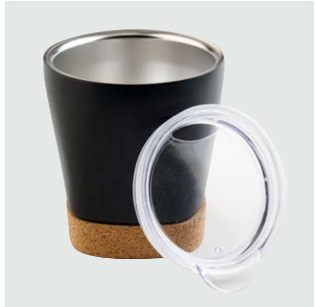
TH 203 Vaso Alpino