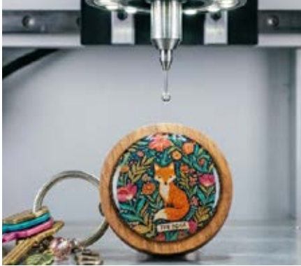
Gota de Resina

Lo anterior da como resultado una personalización impresa o grabada de nuestros productos con alta calidad garantizada.