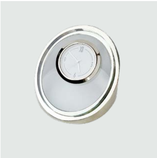
REJ 03 Reloj Tikal