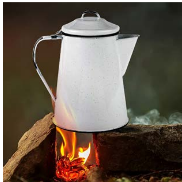
TH 51 Jarrilla Alamo