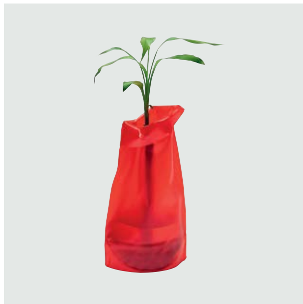
CAS 18 Florero Grande Foldable