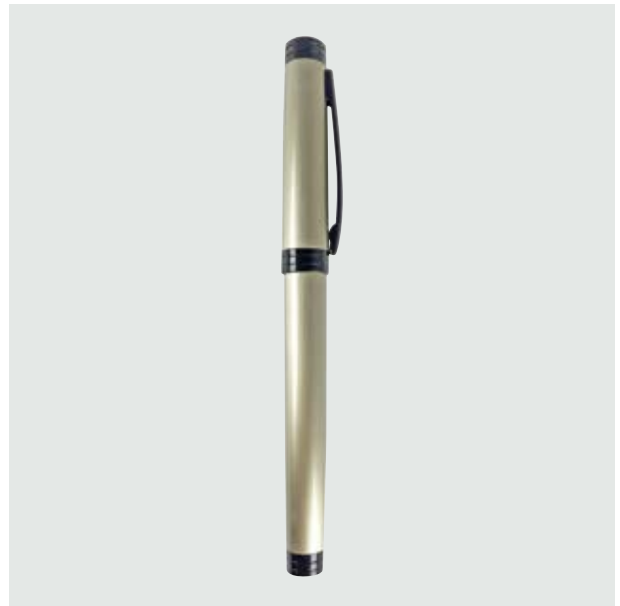
BOL 528 Bolígrafo Zener