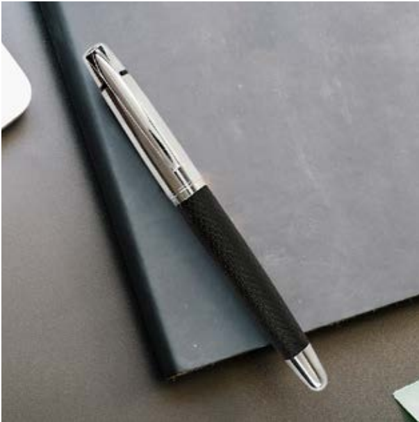
BOL 522 Bolígrafo Turner