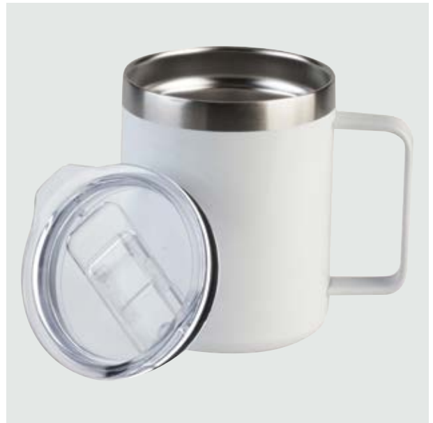
TH 218 Taza Maple