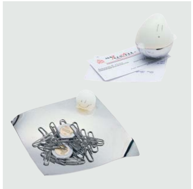
ESC 590 Set Fantasma