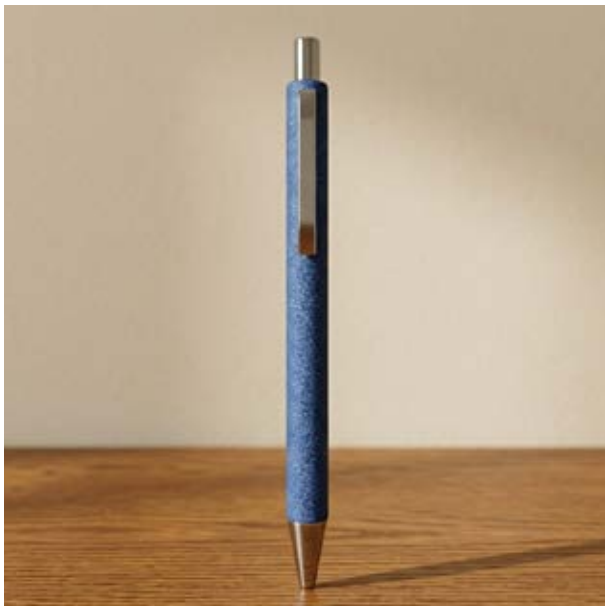
BOL 556 Bolígrafo Rodin