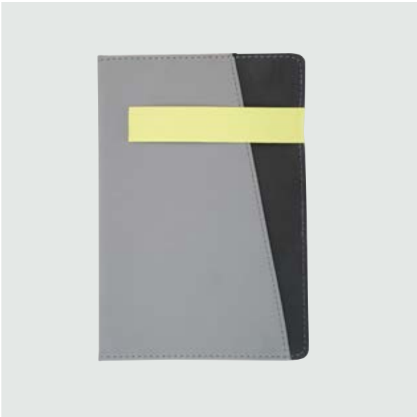
ESC 531 Libreta Moskú