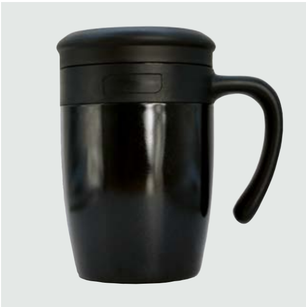
TH 223 Taza Malva