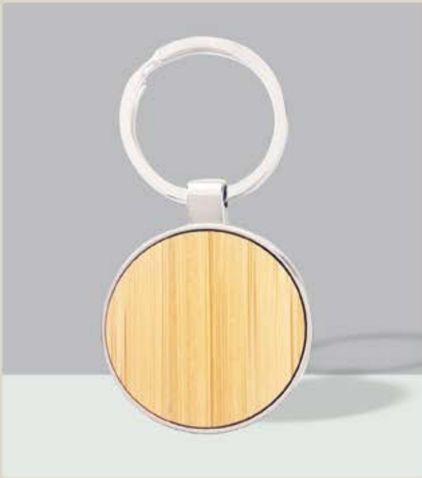
LLA 44 Llaverito Redondo Bamboo