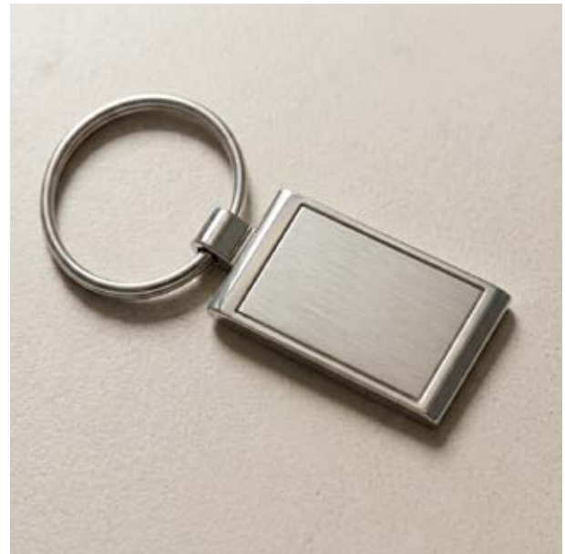
LLA 22 Llaverito Rectangular Sencillo Plano