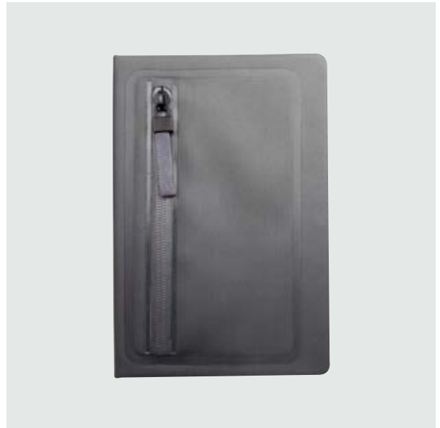
ESC 536 Libreta Denver